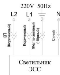
Светильник с аварийным режимом L1 - основное питание L2 - контроль присутствия U (подключать от эл. сети 220В фаза)